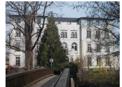
1 số danh lam thắng cảnh lân cận